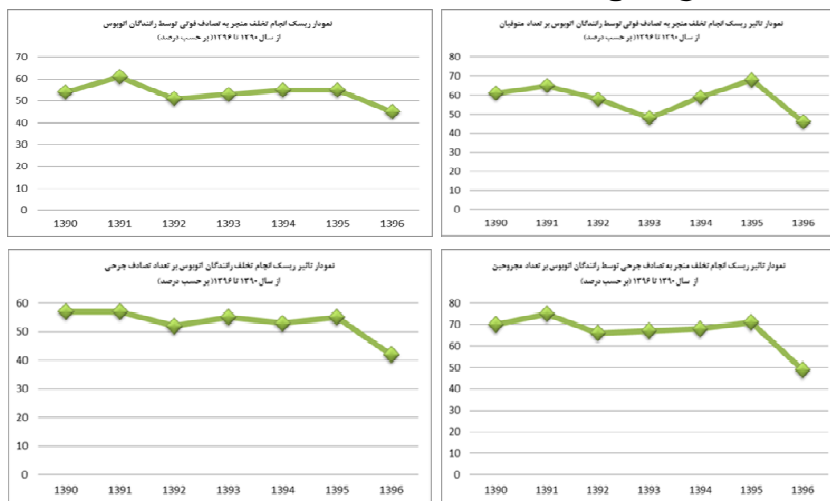
نمودار ۱. تأثیر خطر انجام تخلف توسط رانندگان اتوبوس از سال ۱۳۹۰ تا ۱۳۹۶

غیرمجاز، استفاده از تلفن همراه حین رانندگی، عدم استفاده از کمربند ایمنی و رانندگی بیش از زمان مجاز) به صورت برخط توسط پلیس کنترل گردیده است؛ باکمی اغماض می توان ادعا کرد که این موضوع حکایت از تأثیرگذار بودن سامانه سپهتن بر ایمنی ناوگان حمل و نقل عمومی مسافر، در اثر رعایت مقررات توسط رانندگان اتوبوس های برون شهری داشته است و در نتیجه آن، سهم تقصیر رانندگان اتوبوس در وقوع سوانح رانندگی با کاهش موردقبولی روبهرو بوده است.